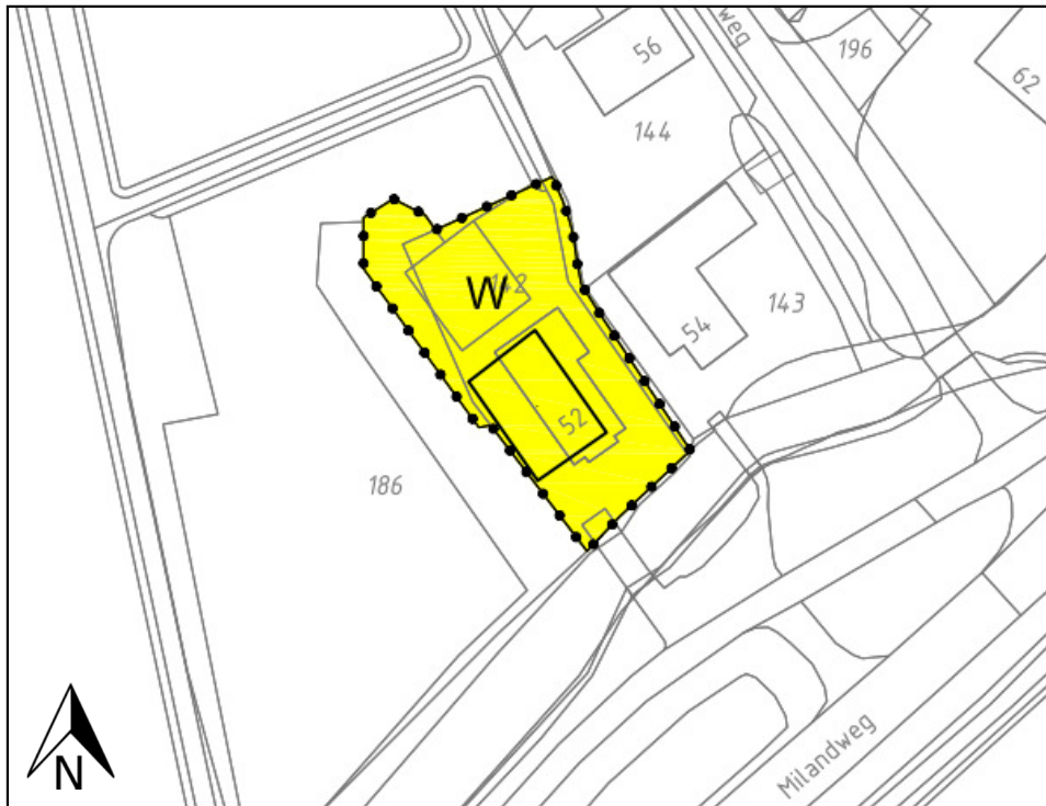
Figuur 1: Uitsnede plankaart