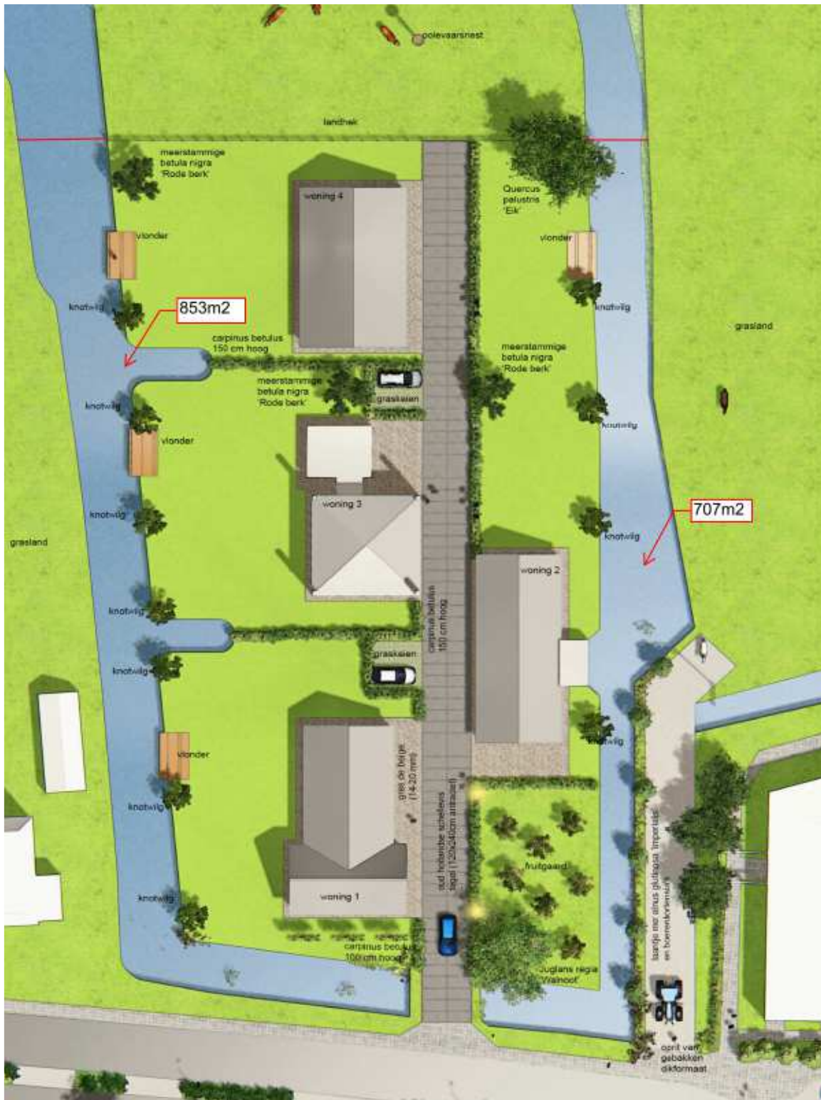
Overzicht waterpartijen na verkaveling