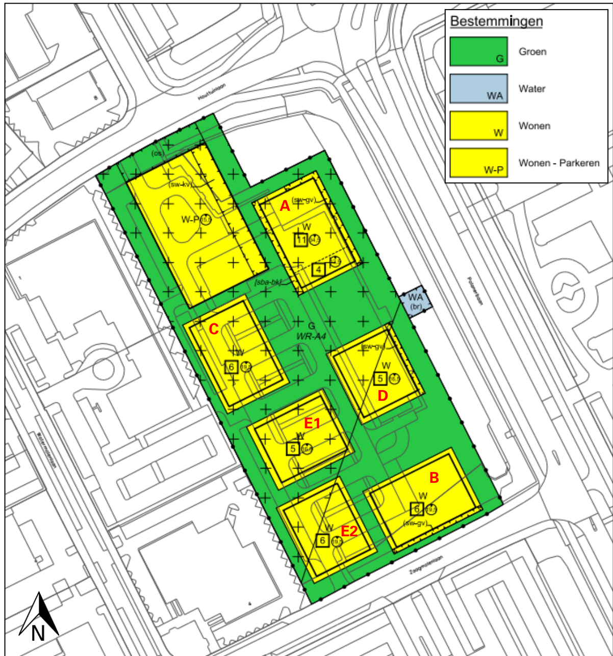
Figuur 1: Uitsnede plankaart inclusief naamgeving appartementengebouwen